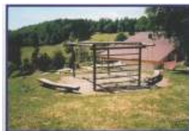
Place de jeux pour enfants sur le côté du chalet

C'est un endroit idéal pour des séjours en famille ou entre amis. Aux abords du chalet, se trouvent une place de jeux pour enfants, une place de pétanque, une table de ping-pong, un terrain de volley-ball, un grill à disposition de tous, plusieurs tables ainsi que de grands espaces accueillants.