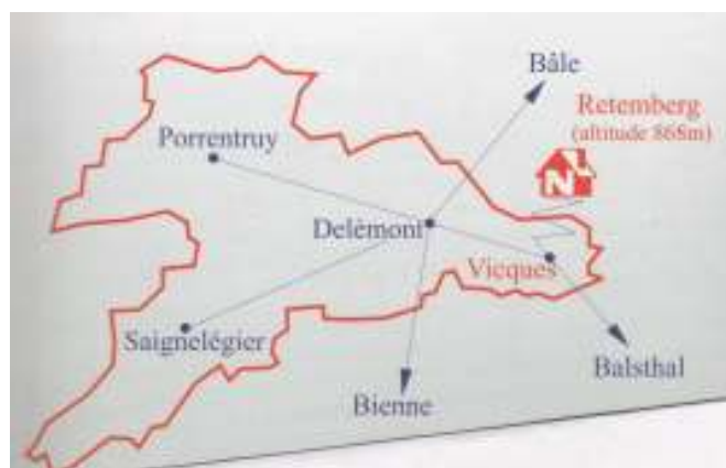
Situation géographique du chalet du Retemberg

De nos jours, l'accès est facile, bien signalé, goudronné et gravillonné sur toute sa longueur. Il faut compter 10 minutes en voiture ou 1h30 à pied depuis le village. Le chemin d'accès est ouvert toute l'année. Des courses spéciales en car postal peuvent même y être organisées.