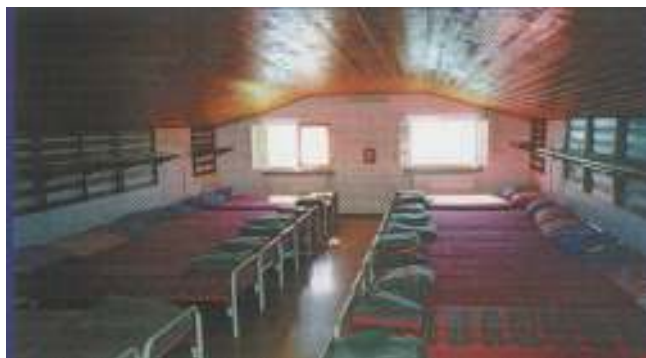
Dortoir de 22 places