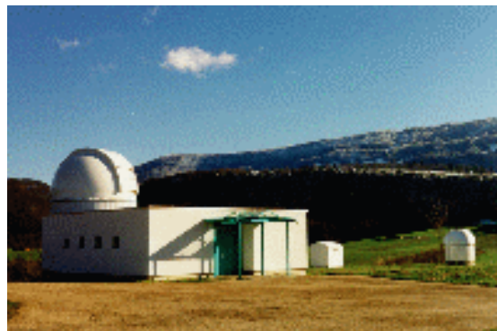
Observatoire de Vicques

La société joue un grand rôle au niveau culturel et social. En effet, on y apprend à vivre en groupe, à se respecter et à s'entraider les uns les autres. C'est un point de rencontre ouvert à tous, on peut se retrouver pour y passer un moment avec des amis et c'est également un but de promenade pour les marcheurs, les cyclistes et même les cavaliers.