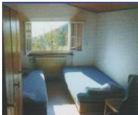
Chambre à deux places

On peut dire que la société des Amis de la Nature fait en grande partie ses bénéfices grâce aux groupes qui passent des séjours au chalet, c'est le revenu le plus important de la société.