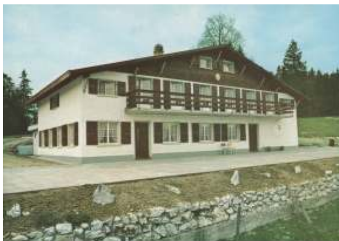
Reconstruction du chalet du Retemberg après l'incendie de 1971

C'est avec beaucoup de solidarité, de volonté et de courage qu'ils décident à l'unanimité de reconstruire leur chalet. Ils commencent à chercher de l'argent et des bénévoles pour aider. Le chalet est reconstruit pierre par pierre et au final, il est encore plus beau et plus grand qu'avant.