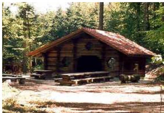
Cabane forestière du Pré Godat

Durant son évolution, le chalet des Amis de la Nature a donné l'impulsion pour la construction d'autres maisons et chalets au village. Par exemple, le chalet des scouts, le stand de tir, la cabane forestière du Pré Godat (prévue pour des pique-niques ou autres), l'observatoire, la cantine du foot, le chalet de la société de pétanque ainsi que celui de l'aéromodélisme.