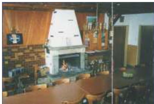
Salle avec cheminée française pouvant recevoir 30 personnes, réservée aux gardiens ainsi qu'aux personnes de passage.

Les classes d'école ou les sociétés de musique sont parfaitement à l'aise dans ce cadre de verdure.