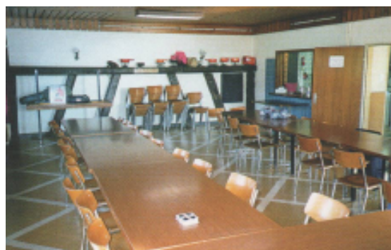
Salle pouvant recevoir jusqu'à 80 personnes, réservée aux groupes et sociétés.

Chaque week-end, le chalet est ouvert, il y a un débit de boissons et une petite restauration. L'organisation de chaque week-end est gérée par une ou deux familles (ou couple) de la société. C'est ce qu'on appelle un gardiennage.