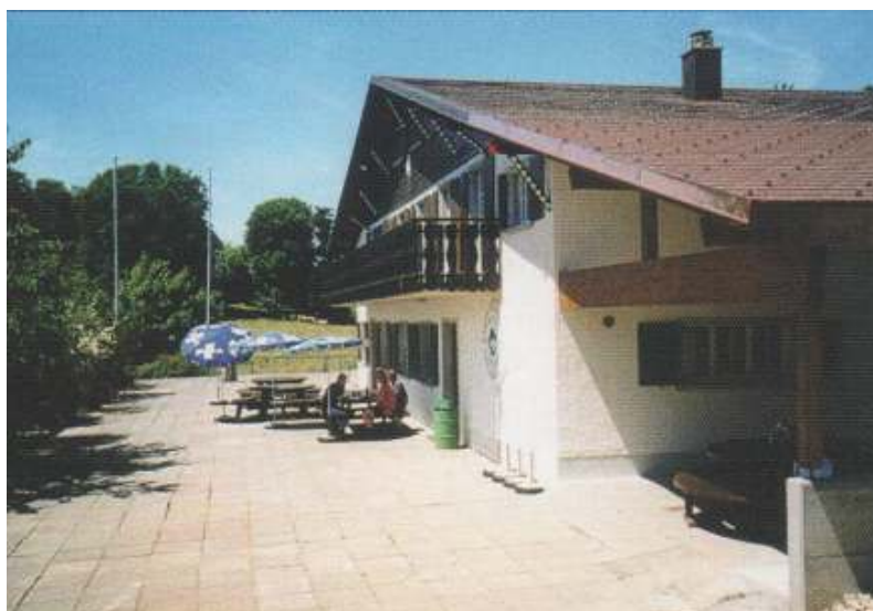
Annexe sur la droite du chalet

Aujourd'hui, c'est toujours le même chalet que l'on peut apercevoir depuis le village. Il a encore connu quelques travaux d'amélioration comme la construction d'une annexe sur la droite du chalet dans le but d'avoir un endroit abrité à l'extérieur. La cheminée a également été changée ainsi que dernièrement, la cuisine.